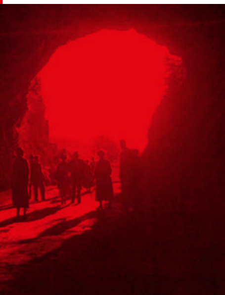
Photographie d'Alain et Sylvie Ballester, Les Caves de la zone - Composteur et fondation - 2015, 100x100 cm, série communication - Cavaudor Impression - Impression Mergel, Toulouse

ENTRÉE LIBRE ET GRATUITE OUVERT DU MERCREDI AU DIMANCHE