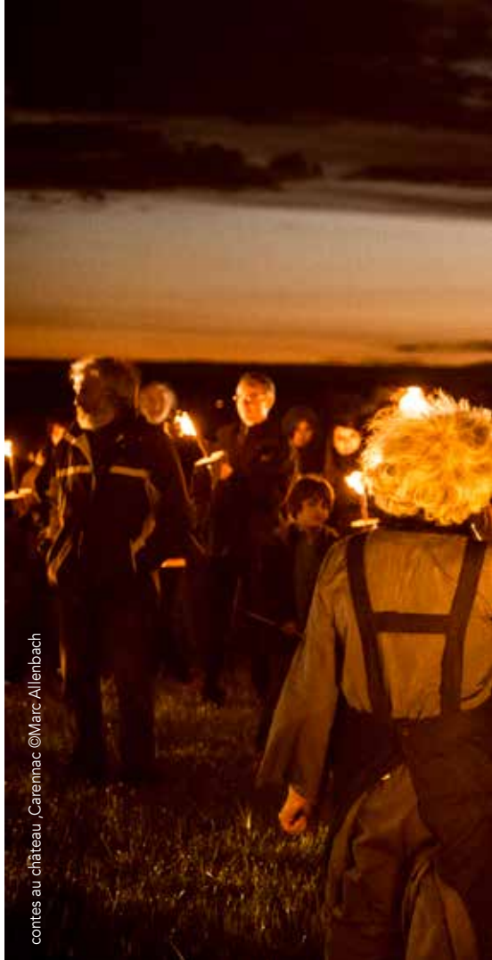
contes au château - Carennac

À partir de briques de sucre et de ciment alimentaire, petits et grands pourront s'amuser à construire des architectures miniatures un peu folles. Les empilements et jeux d'équilibre issus de leur imagination seront alors comme autant de douces utopies, que tous pourront ramener à la maison.